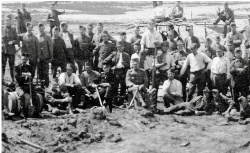
Groep militairen bij een loopgraaf op de Edese heide (1917)

Ook is er vraag naar lokale bronnen. Want, welke impact had het nationale verhaal in de lesmethode op onze eigen regio? Bovendien zorgen deze bronnen voor herkenbaarheid in de eigen omgeving, waardoor ze aansprekend zijn voor leerlingen en studenten.