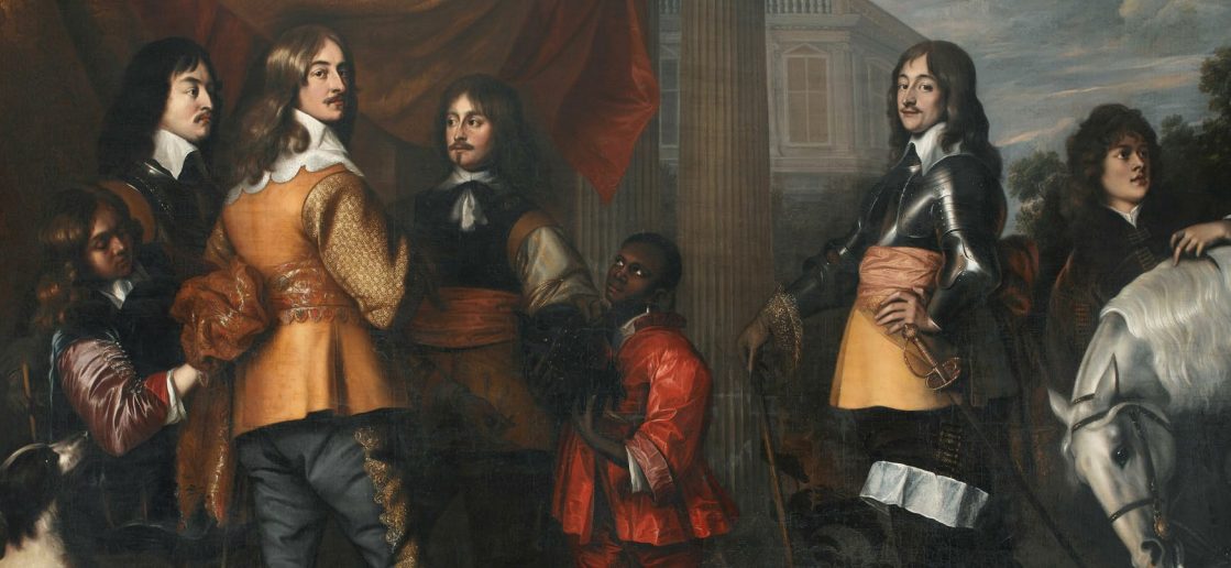
Wandschildering in Nassauzaal van Stadhoudelijk Hof te Leeuwarden uit 1660, Historisch Centrum Leeuwarden