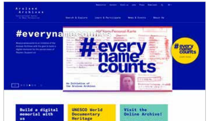
Afb. 4 Screenshot van de website van Arolsen Archives

Ten slotte is het cruciaal, dat erfgoedinstellingen ervaringen op dit terrein blijven uitwisselen en gezamenlijk optrekken bij het digitaliseren en online plaatsen van dit belangrijke deel van ons erfgoed. Hierbij kan ook geprofiteerd worden van internationale ervaringen zoals van Arolsen Archives.