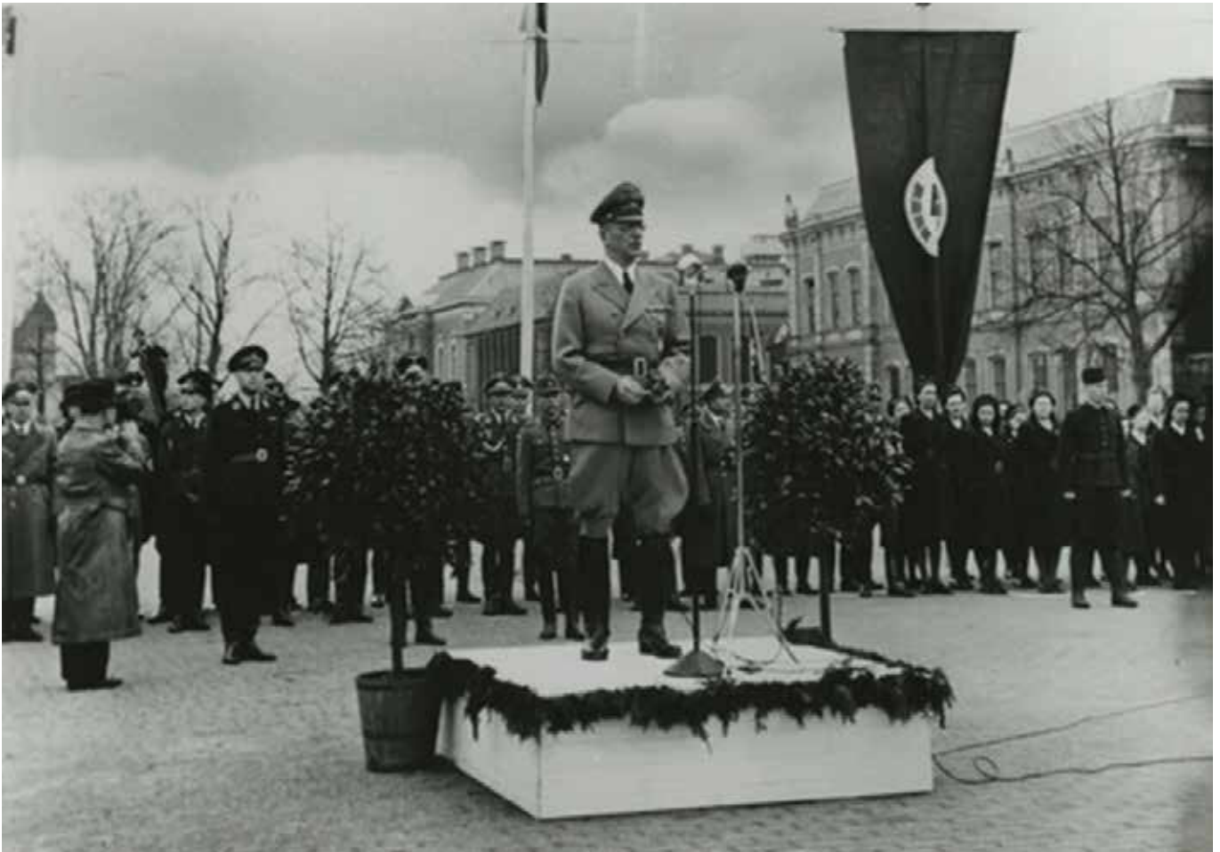
Seyss-Inquart bezoekt een nationaalsocialistische bijeenkomst op het Wilhelminaplein (Zaailand) te Leeuwarden. Leeuwarden, 4 april 1943

daarbij wel benadrukt, dat het in Nederland momenteel nog ontbreekt aan laagdrempelige, feitelijke uitleg van de oorlog en idem informatie over het zoeken in oorlogsarchieven, zoals dat wel in België bestaat. 21 Meerdere nabestaanden hebben ervaring met het zoeken in de oorlogsarchieven en de hoge moeilijkheidsgraad daarvan. Zij vinden het een grote vooruitgang wanneer zijzelf als familie direct online toegang krijgen, waarbij sommigen het nu nog een stap te ver vinden, dat dit voor iedereen zou gelden. Daarnaast stellen nabestaanden, dat de ergste oorlogsmisdaden allang bekend zijn, daarover zijn in de naoorlogse jaren openbare rechtszaken geweest en dat heeft in alle kranten gestaan. Het zijn juist de minder zware vormen van collaboratie, die bij