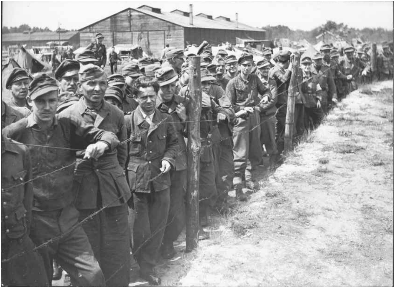
Interneringskamp voor Nederlanders die zich vrijwillig bij de Waffen-SS hadden aangemeld, juni 1945

andere kinderen en soms ook door volwassenen, zelfs onderwijzers, ernstig gepest, publiek vernederd, uitgescholden en gemeden. 18 De gezinnen leefden bovendien in veel gevallen in grote armoede. Ook in hun latere carrières en levens hebben zij vaak ernstig geleden onder het foute verleden van hun familie. Onschuldig en toch gestraft, zo voelt het voor hen. Voor later geboren nabestaanden geldt dit alles niet, zeker niet in deze mate. Kinderen, soms ook kleinkinderen, van collaborateurs hebben als gevolg van slechte jeugdervaringen veelal hun hele leven gezweven over het familieverleden en doen dat tot op de dag van vandaag. Ook tegen hun eigen kinderen. Zij hebben een grote angst voor ontdekking van dat verleden wanneer de oorlogsarchieven onbepaald openbaar zouden worden. Vooral zijn zij bang dat de