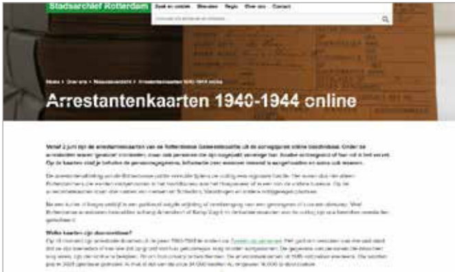
Afb. 1 Screenshot van crowdsourcingproject rondom arrestantenkaart van het Stadsarchief Rotterdam