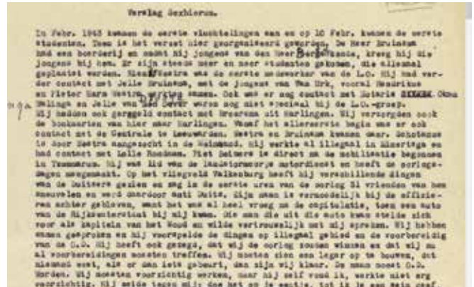
Afb. 3 Fragment uit de getypte interviews met verzetssensen, 1946-1955