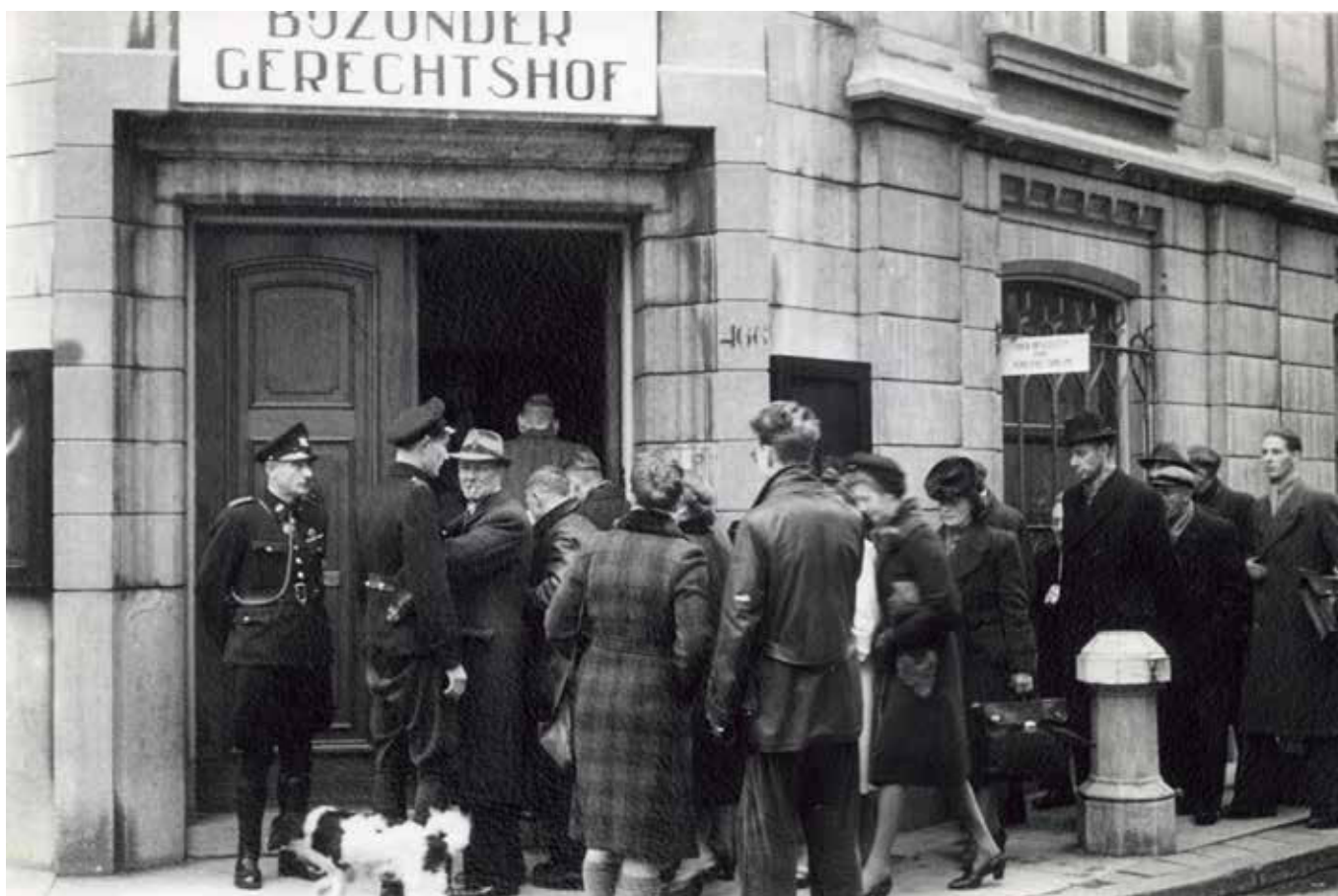
Een rij bezoekers voor de publieke tribune wordt binnengelaten in het gebouw van het Bijzonder Gerechtshof in Amsterdam op de hoek van de Spiegelstraat-Herengracht. Amsterdam, datum onbekend

Op dit verbod worden in artikel 9 lid 2 onder j enkele uitzonderingen gemaakt, waaronder verwerkingen met als grondslag 'archivering in het algemeen belang, wetenschappelijk of historisch onderzoek of statistische doeleinden'. Hierbij worden méér voorwaarden voor verwerking gesteld dan bij de niet-bijzondere persoonsgegevens: 'de evenredigheid met het nagestreefde doel wordt gewaarborgd, de wezenlijke inhoud van het recht op bescherming van persoonsgegevens wordt geëerbiedigd en passende en specifieke maatregelen worden getroffen ter bescherming van de grondrechten en de belangen van de betrokkene'.