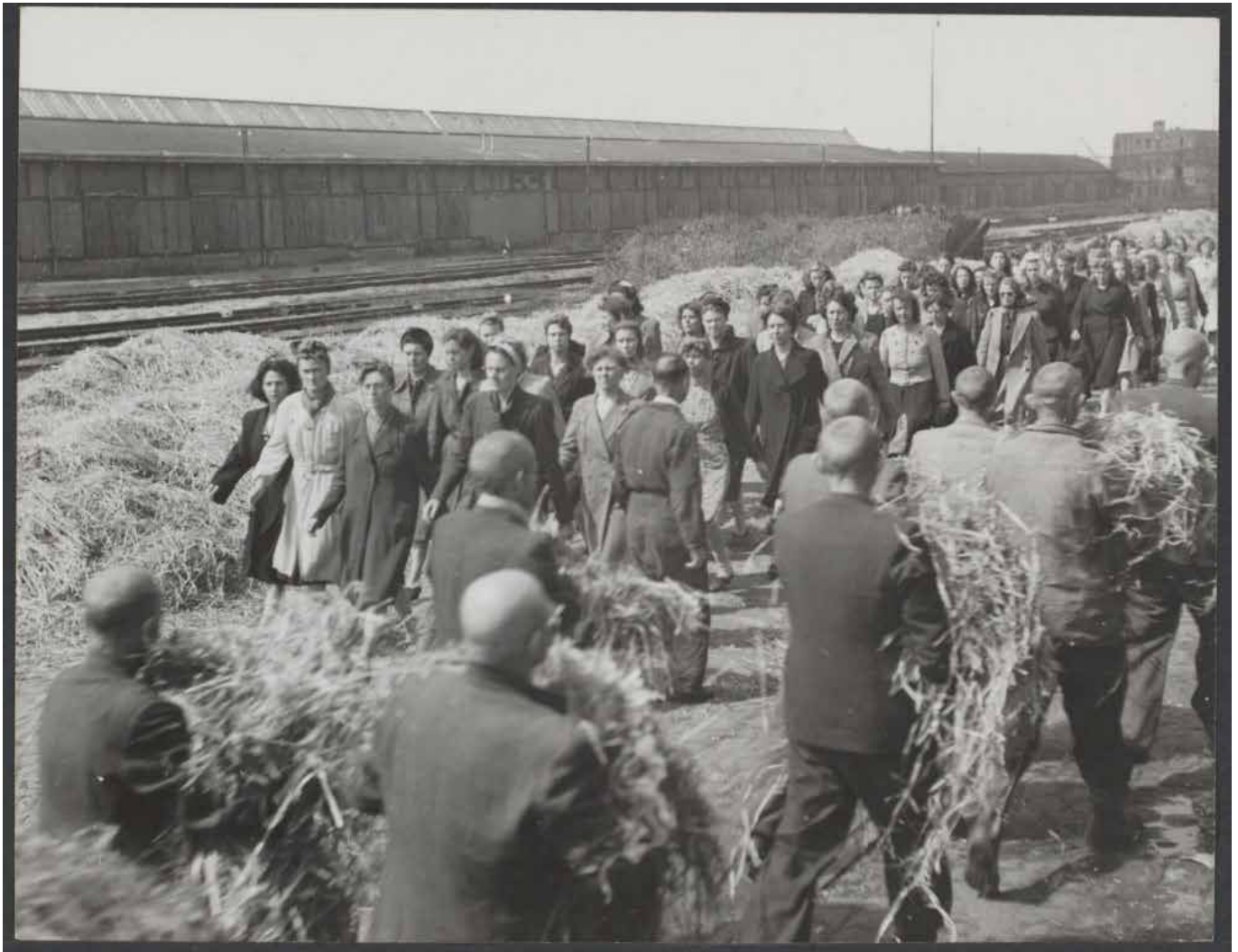
Interneringskamp voor verdachten van collaboratie aan de Levantkade te Amsterdam. Amsterdam, 1 juni 1945. (Collectie Spaarnestad/Nationaal Archief)

en professionele geschiedschrijving over de oorlog door online publicatie in alle facetten enorm worden gestimuleerd. 25 Dit is nodig om het collectieve geheugen van Nederland op te frissen zodat we als samenleving aan de collectieve verwerking van dat verleden toekomen. Daarbij passen historische vragen die verder gaan dan de vraag wie schuldig was en wie slachtoffer. Vragen naar het 'waarom' van de oorlog moeten worden gesteld, zoals: wat