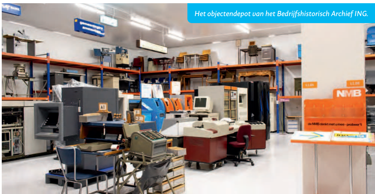
Het objectendepot van het Bedrijfshistorisch Archief ING.

Dit artikel is het eerste in een serie van drie, waarin de VBH aandacht schenkt aan de specifieke eigenschappen van historische bedrijfscollecties en archieven.