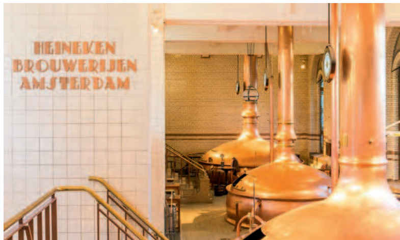
Zelfs gebouwen en apparatuur kunnen onderdeel zijn van een bedrijfshistorische collectie. Het brouwhuis uit 1913 vormt het hart van de 'Heineken Experience'.