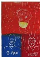
11 | Internationale rappers