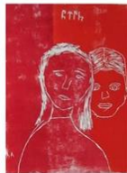
20 | Eilish & Gomez