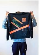
30 | Yeezy's