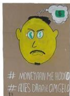
13 | Rijk worden