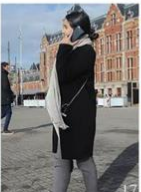
17 | Sociaal leven