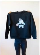
7 | Eigen stijl