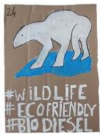
24 | Milieu