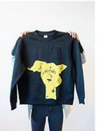
28 | Face Tats