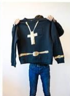
3 | Accessoires