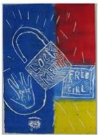
36 | Yolanthé Cabau