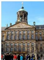
4 | Dam