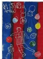
2 | Sporthelden