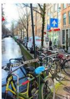
31 | Fietsen