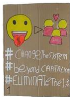
1 | Beter economie