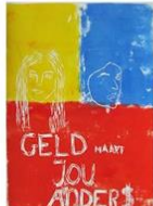
23 | Kylie Jenner