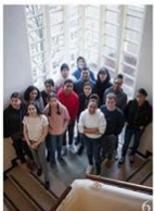
6 | Multicultureel