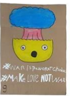
9 | Vreedzame samenleving