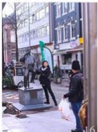
16 | Toerisme