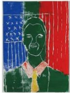
25 | Obama