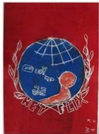
15 | Internet sterren