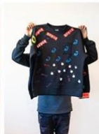
12 | Merkpullen