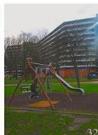
32 | Flats