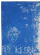
5 | NL rappers