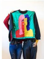
22 | Natural >< fillers