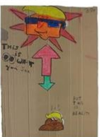
37 | Weg met Trump