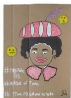
34 | Bullshit discussies