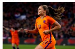
Lieke Martens, beste voetbalvrouw 2017