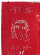
35 | Nikkie tutorial