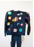
19 | Telefoon