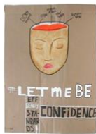
21 | Respect voor vrouwen