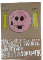
38 | Wat van je leven maken