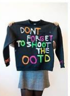
39 | OOTD