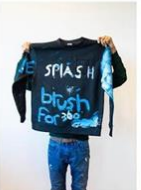
29 | Opscheertje/Golfje