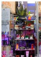
33 | Wiet