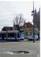
8 | OV