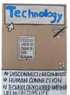
27 | Technologie voor iedereen