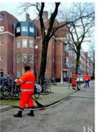
18 | Groen in de stad