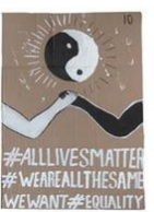
10 | Geen racisme