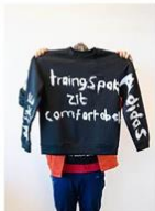
14 | Trainingspakken