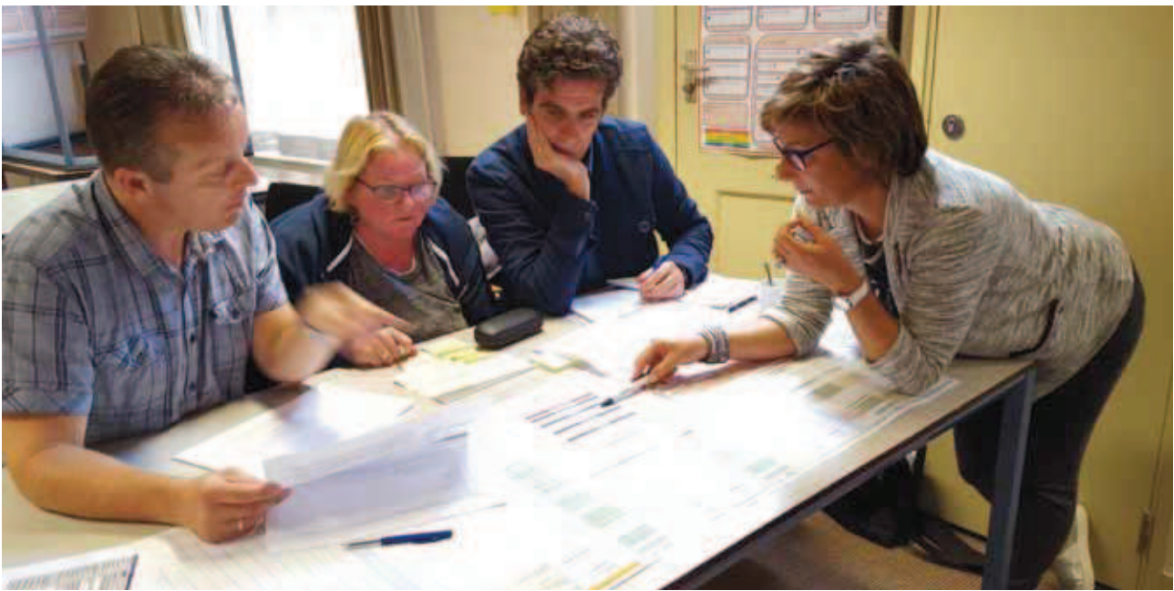
Werken met TML0, workshop van de Zeeuwse werkgroep, 6 oktober 2016.

>> worden bestempeld. Onder hen het e-Depot van het Zeeuws Archief.