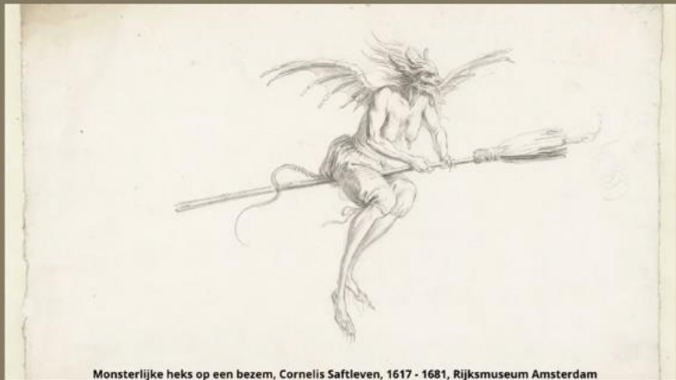
Monsterlijke heks op een bezem, Cornelis Saftleven, 1617 - 1681, Rijksmuseum Amsterdam