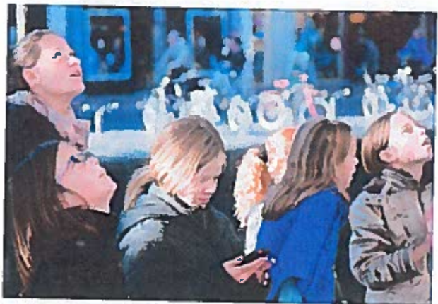
Smartphonewandeling Leeuwarden in de Gouden Eeuw.

In het Fries Museum bezochten leerlingen de tentoonstelling Oud Geld , waar alles om geld en invloed draaide. Aan de hand van vijf markante figuren werd onderzoek gedaan naar de machtsverhoudingen in het gewest Friesland: stadhouder Willem Frederik, die op zoek moet naar een geschikte echtgenote; jonkvrouw van Pipenpoy, die het niet treft met de mannen in haar leven; Van Sminia, de rijkste man van Friesland maar zeker niet de gelukkigste; portretschilder De Geest, die alle vips vastlegt op het witte doek; en de brave geleerde Saeckma, die alles doet wat zijn vader van hem verwacht. Bij Tresoar bestudeerden de leerlingen het florilegium van de Leeuwarder kunstenaar Franciscus de Geest. Zijn encyclopedische catalogus is een overzicht van bloemen in Friese tuinen. Leerlingen deden onderzoek naar het verschil tussen florilegio en kruidenboeken. Zij ontdekten hoe wetenschappers in de 17e eeuw kennis vergaarden over planten en bloemen uit de hele wereld.