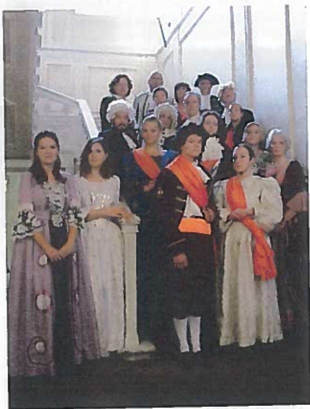
Living history over de 18e eeuw.