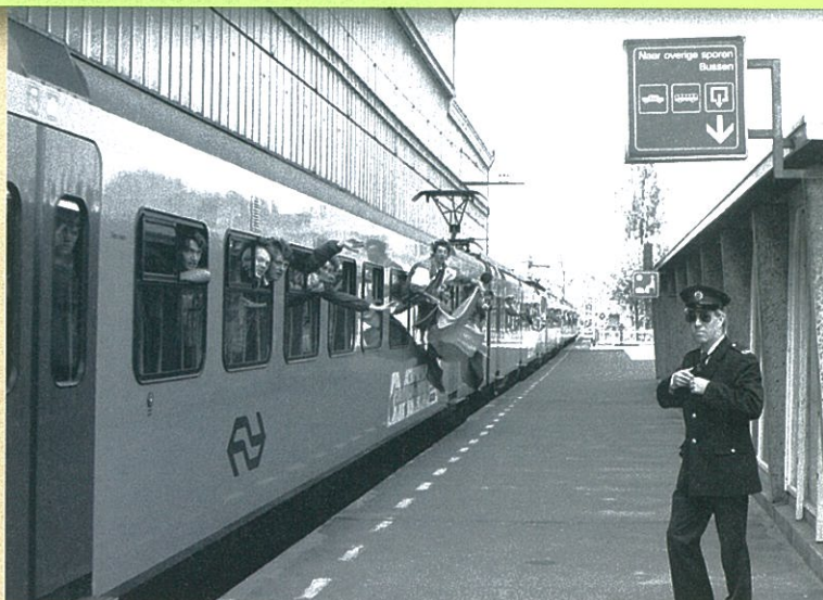
Aankomst van een trein met Haagse voetbalsupporters op Station Haarlem, 1987.