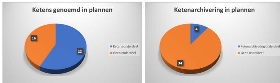
Ketens en ketenarchivering in actieplannen Open op Orde

In totaal zijn 38 actieplannen bekeken. In 22 daarvan komt het onderwerp ketens aan de orde, in slechts 4 plannen wordt ketenarchivering benoemd.