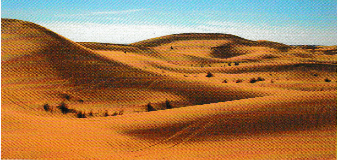
'We bevinden ons in een fuzzy, barbaars landschap. Hoe kun je daarin bepalen wat effectiviteit is?'

>> Dit is overigens niet geruststellend bedoeld. Er is namelijk naar mijn indruk veel meer aan de hand dan de positionering van een professional in een bestaande structuur.