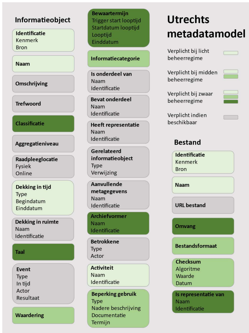
Afbeelding 1. Verplichte attributen voor licht, midden en zwaar beheerregime